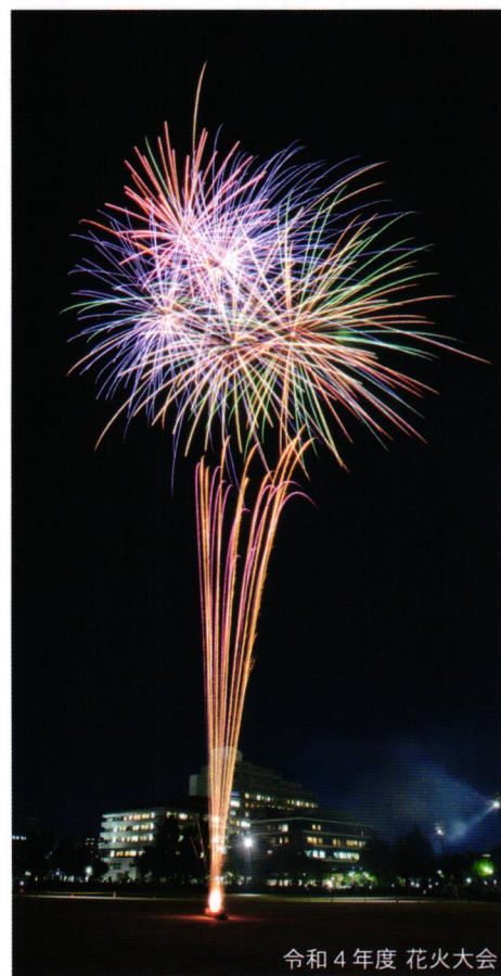
令和4年度 花火大会